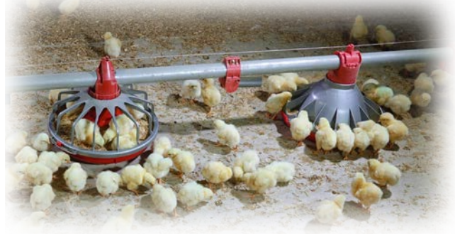
Tres días de edad