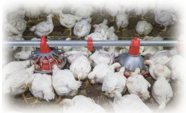
39 días de edad

Las aves jóvenes se pueden meter en los comederos con rejillas. Obstruyen el acceso al alimento para otras aves y lo contaminan con sus heces.